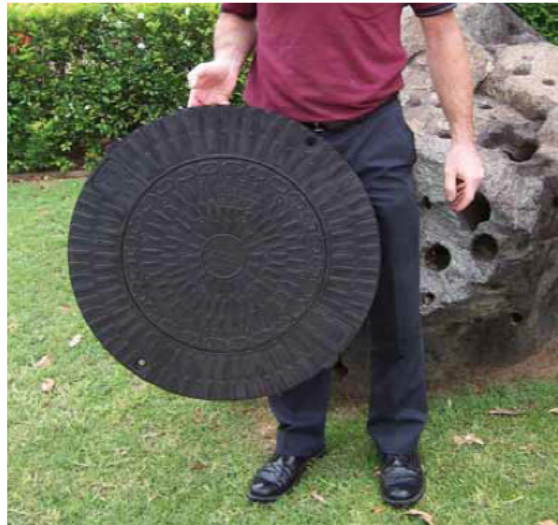
Lagan poklopac < 9 kg