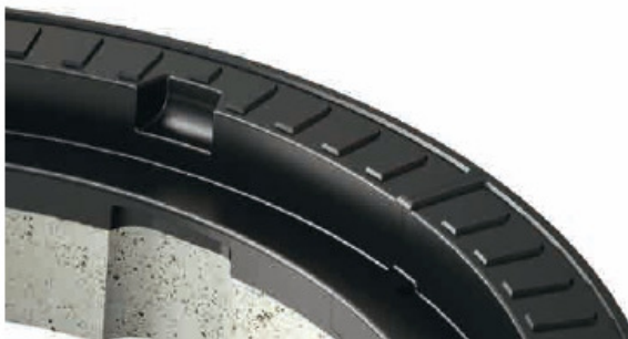
Ram od polipropilena i betona